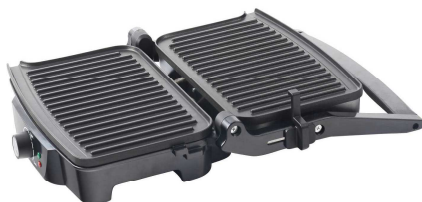
Открытие панелей на 180°