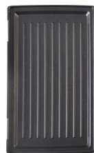
Размер 1 панели 29.7x23.5 см