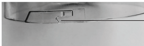
Выступ на чаше